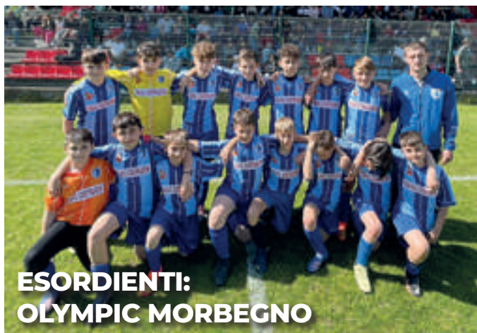
ESORDIENTI: OLYMPIC MORBEGNO