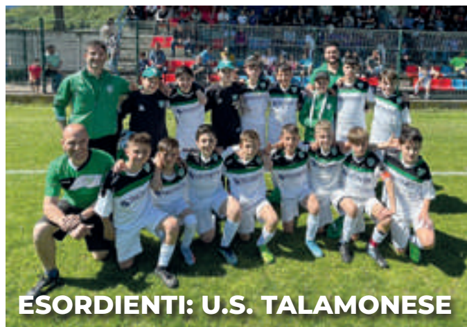
ESORDIENTI: U.S. TALAMONESE