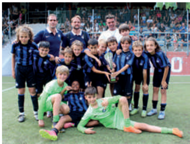
INTER 3ª classificata