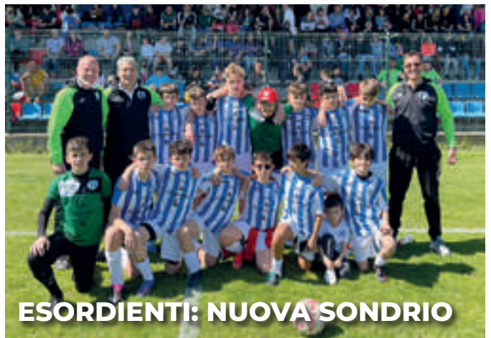
ESORDIENTI: NUOVA SONDRIO