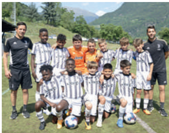
JUVENTUS 5ª classificata