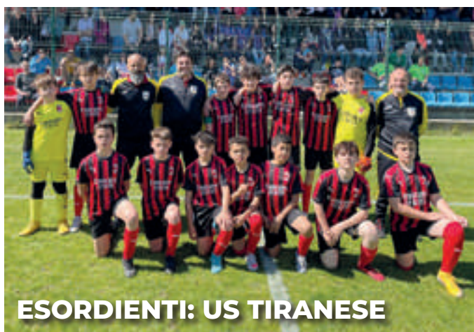
ESORDIENTI: US TIRANESE