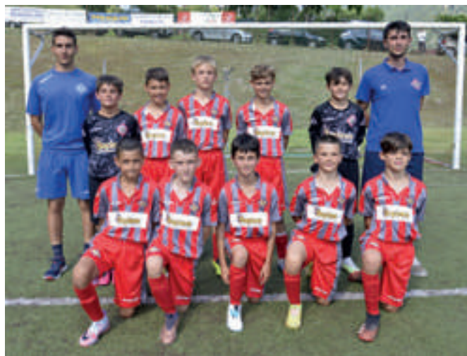
CREMONESE 2ª classificata

A seguire nell'ordine Piantedo, ColicoDerviese, Tiranese, Talamonese, Nuova Sondrio, Albosaggia Ponchiera, Grentarcadia, Bormiese.