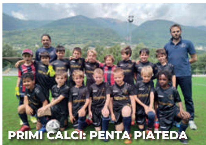
PRIMI CALCI: PENTA PIATEDA