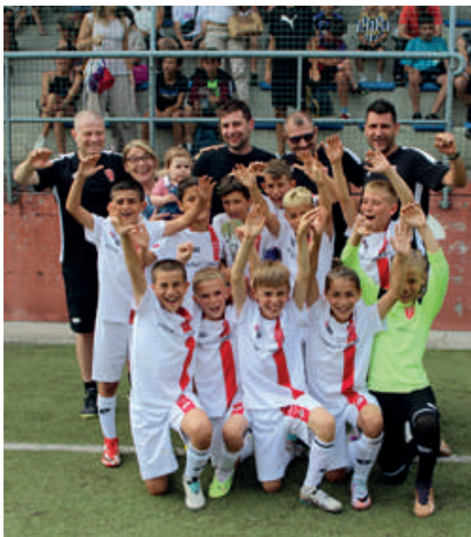
MONZA 1ª classificata