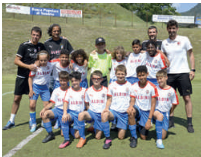
ALDINI 6ª classificata