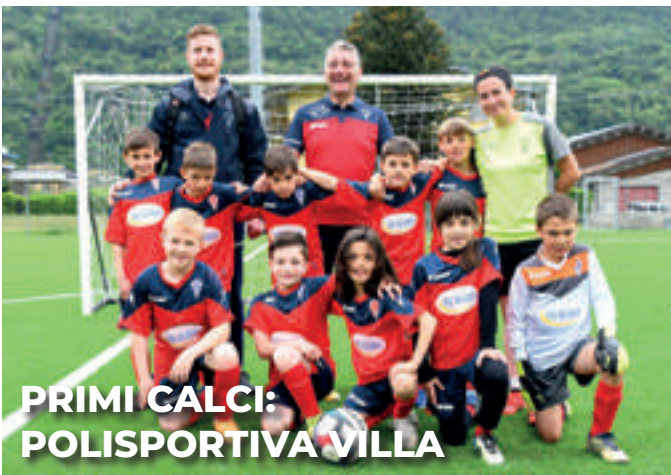
PRIMI CALCI: POLISPORTIVA VILLA