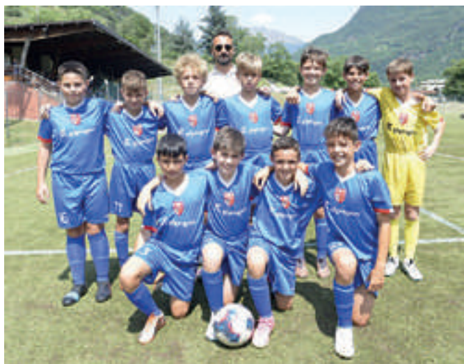
CASATESE 4ª classificata