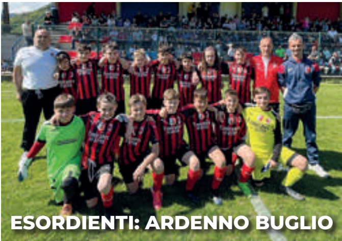
ESORDIENTI: ARDENNO BUGLIO