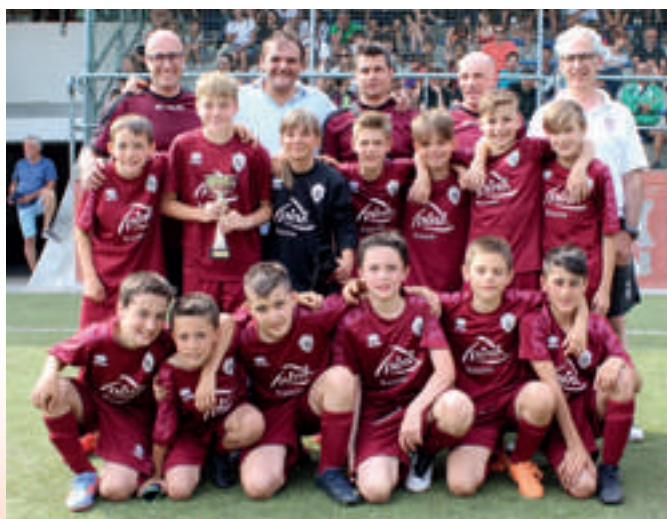
Grosio 8ª classificata