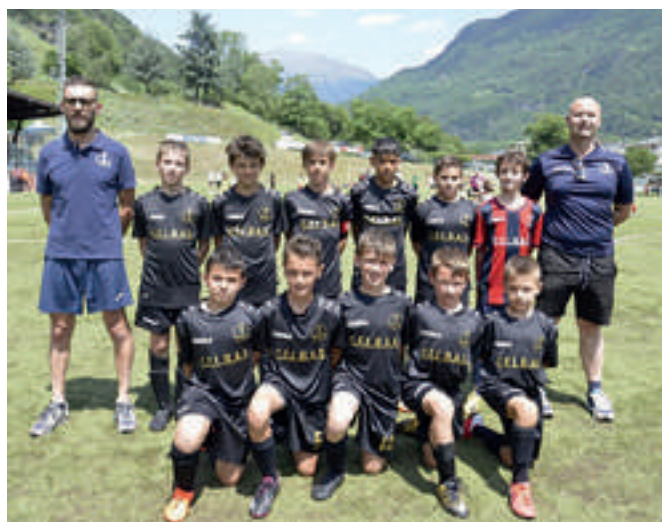
PENTAPIATEDA 7ª classificata